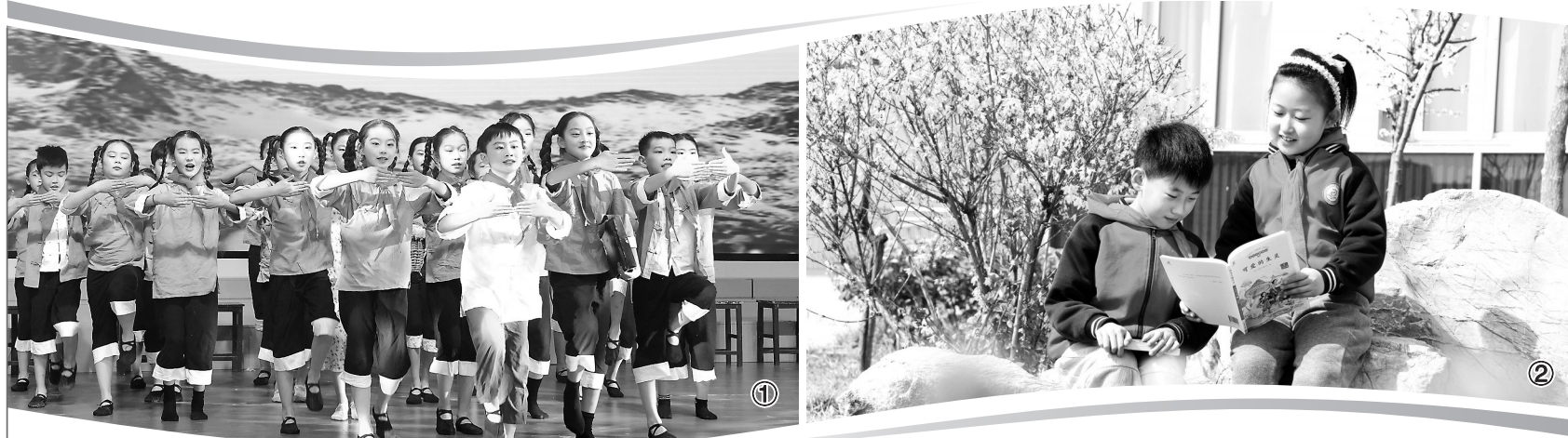
①临朐县东城街道文昌小学学生正在演绎课本剧《红色先锋》。 ②临朐县辛寨街道卧龙湾小学学生手捧书籍，沉浸在阅读的世界里。