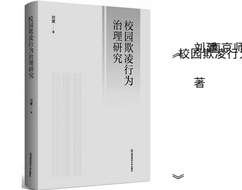
《校园欺凌行为治理研究》 刘建 著