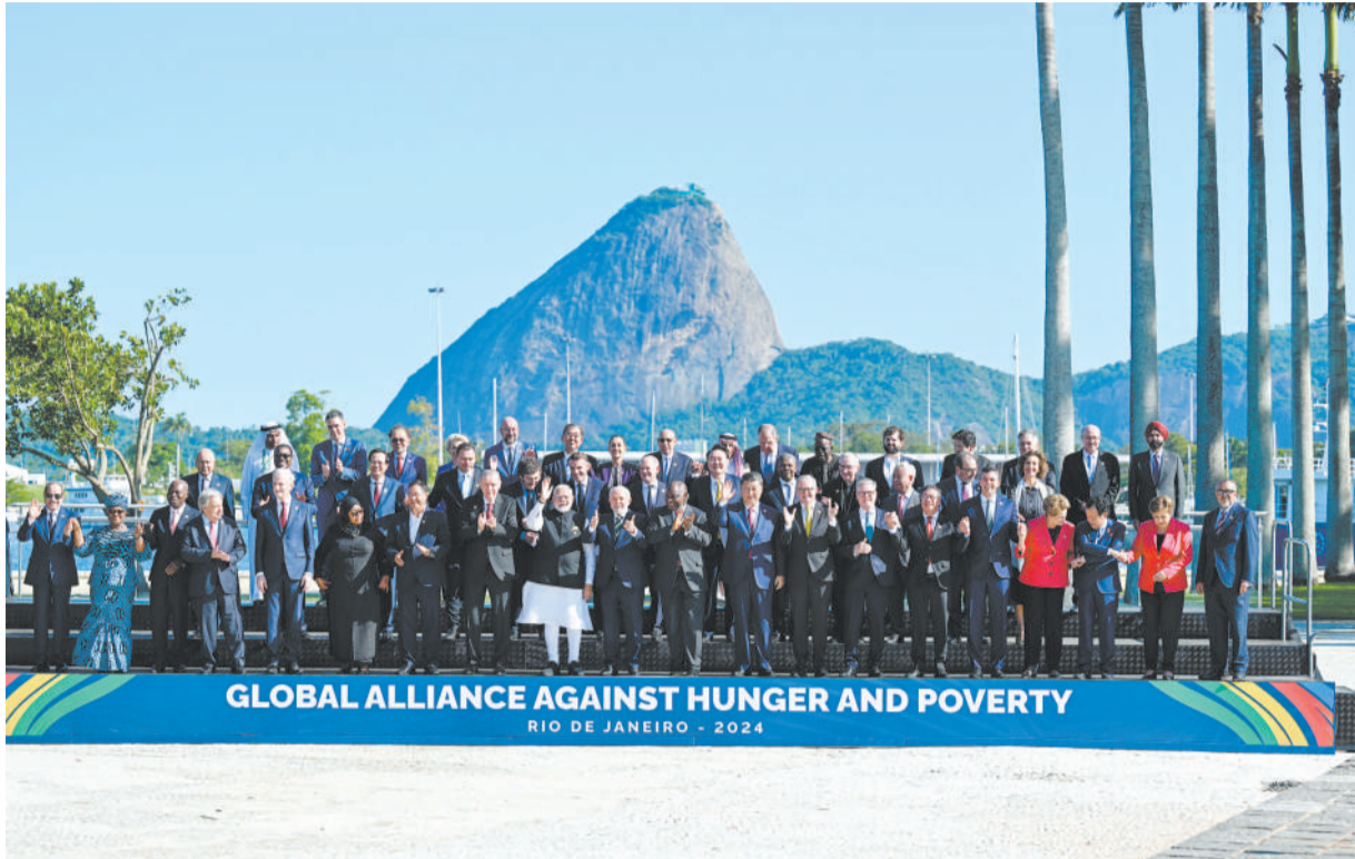
当地时间11月18日上午，国家主席习近平在巴西里约热内卢出席二十国集团领导人第十九次峰会。峰会把“构建公正的世界和可持续发展的星球”作为主题，并决定成立“抗击饥饿与贫困全球联盟”。这是习近平同与会领导人共同参加巴方发起的“抗击饥饿与贫困全球联盟”合影。