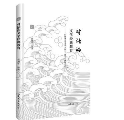
《对话的文学经典教育》 张丽军 等著 山东文艺出版社

通过阅读这本对话录，不仅可以提炼名家名作的精髓，还能感受到文学课堂润物细无声般的思政教育。研读文学经典可以让学生增强