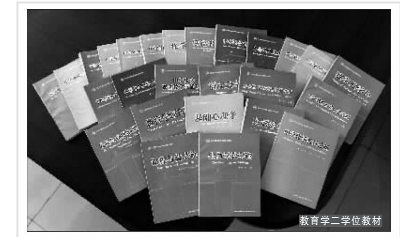
教育学二学位教材

坚持和完善双学位教师教育人才培养模式。学校“十一五”时期坚持和完善了双学位教师教育人才培养模式,开展“本硕连读的优秀教师人才培养模式”探索工作,加强了教师教育方面专业、课程和教材建设。学校制定《关于深化双学位教师教育人才培养模式改革的意见》等文件。2010年学校开始实施“优秀教师培养实验班”改革试点工作,印发《关于做好教师教育创新培养模式人才培养方案研制工作的通知》。学校的《高等师范院校双学位教师教育人才培养模式改革实践与研究》被评为内蒙古自治区级教学成果一等奖。