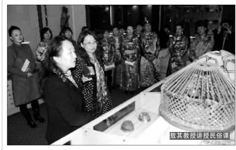
教其教授讲授民俗课

教师教育的双专业思想。综观世界教师教育的发展,教师必须专业化,也只有专业化的教师才能够适应教育发展的要求。1966年国际劳工组织和联合国教科文组织提出的《关于教师地位的建议》,被认为是首次以官方文件形式对教师专业化做出的明确说明。该建议提出:“应把教育工作视为专门的职业,这种职业要求教师经过严格地、持续地学习获得并保持专门的知识与特别的技术,它是一种公共的业务。”我国于1993年颁布的《中华人民共和国教师法》,首次以立法的形式明确“教师是履行教育教学职责的专业人员”,这里的教师专业应理解为既包括学科专业,也包括教育专业。因此,教师教育必须将学科专业和教育专业教育并重。