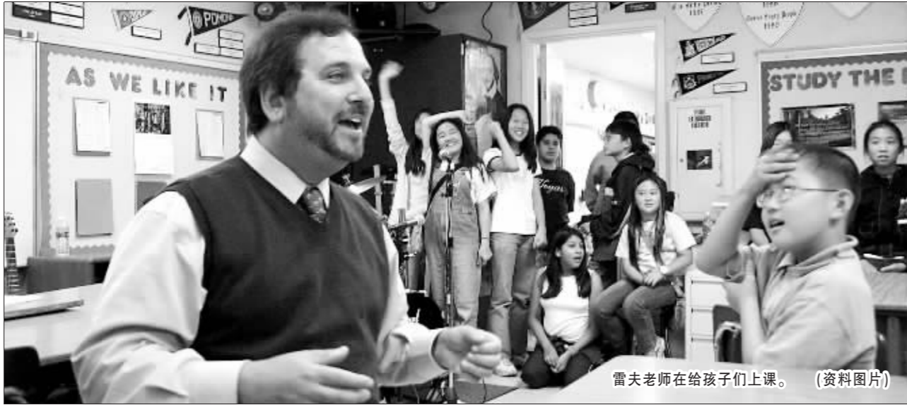
雷夫老师在给孩子们上课。(资料图片)

事。那是他的两个学生,一个是非常聪明的男孩,一个是很可爱的女孩。他们相互喜欢,但喜欢的程度有点不同。男孩愿意为女孩每天早到学校,帮她清理桌子。但女孩对他并不感兴趣,因为在第56号教室里,大家都喜欢善良的人,而男孩对进步很慢的同学态度比较鲁莽,不太愿意帮助其他人。有一天,雷夫听到这样的对话: