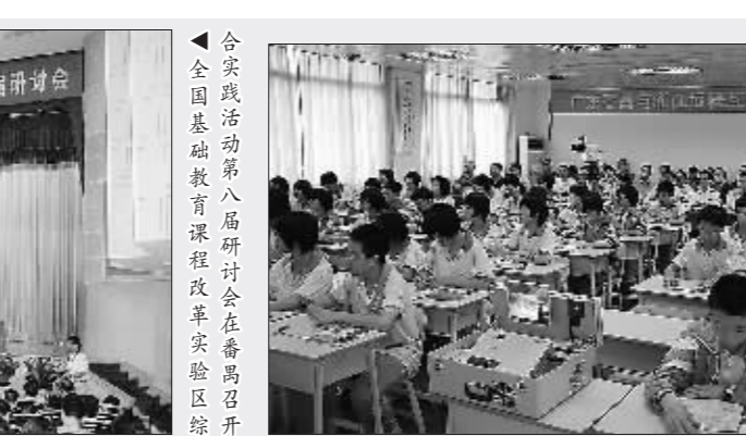
教研经常与外地开展远程互动

2000年,番禺“撤市设区”,成为广州率先实施积分办法,落实优秀外来子女人读义务教育公办学校,全区义务教育阶段非本地户籍学生达79260人。 番禺区还构建了与快速城市化和学习型城市建设相适应的公共教育服务体系。该区中等职业教育多项发展指标位居全市前列,如中职招生规模和在校生数全市第一;中职毕业生就业率、“双证书”全市第一;技能人才培养水平全市领先等。该区以电视大学、职业技术学院为龙头,镇(街)社区教育学校为主体,村社区教育辅导站为基础的三级社区教育网络迅猛发展,培训对象和培训内容不断拓展,每年开展各项培训达20万人次以上,为市民强化成人教育、满足终身教育服务。构筑了“龙头带动、城乡一体”的教育网络,促进职业技能教育、文化教育、艺术教育、休闲娱乐等公共资源在城乡之间均衡配置、平等共享、资源整合利用。该区于1993年自主筹建的番禺职业技术学院,至2008年调整为“市区共建、以市为主”办学。该院于2009年通过国家示范性高职院校建设验收,毕业生就业率一直稳居全省高校前列,成为全省高等职业教育品牌。 5年来,通过不断深化教育改革,推进教育创新以及大手笔的经费投入,全区基本形成了基础教育、职业教育、成人教育和高等教育协调发展,公办、民办、联办等多种办学体制并存的办学格局,现代国民教育体系完善,现代终身教育体系基本形成。全区现有公办学校189所、幼儿园5所,其中小学144所(含特殊教育学校1所)、初中29所(含九年一贯制学校2所)、普通高中15所(含完全中学9所和新成立的番禺实验中学)、中等职业教育学校2所;另有成人文化技术学校11所、电大、党校、教师进修学校、成人教育中心学校各1所;辖区内还有广州大学城的众多高等院校以及一大批各类学习型组织、学习型社区,确立了辖区内高等教育资源在广州市乃至全省的龙头地位,这既使番禺在区域教育现代化的内涵更加丰富,又助推番禺教育的知名度和影响力日益扩大。番禺充分发挥毗邻港澳,海外侨胞众多的优势,坚持开门办学,扩大开放。仅近3年来,组织校长、教师到香港、澳门和出国学习考察就达870多人次。职业技术学院