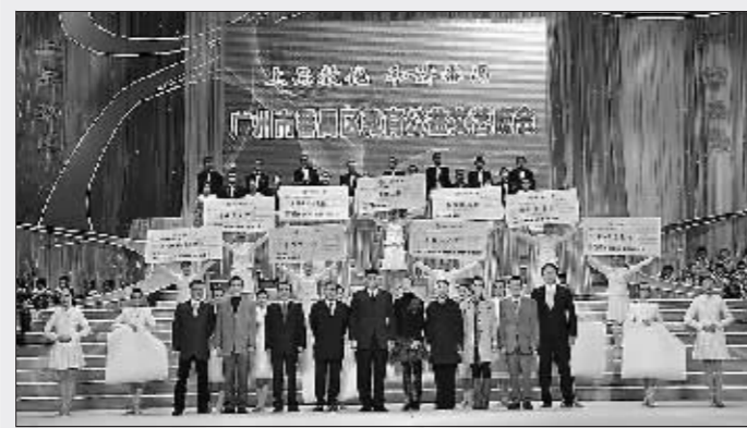
教育公益文艺晚会

为适应改革开放后教育发展的需要,原番禺市委、市政府出台《关于深化教育体制改革的决定》,积极落实分级办学管理体制,通过大力普及九年义务教育;调整普职比例,大手笔、高档次建设一批普通高级中学,实施普及高中教育,完善教