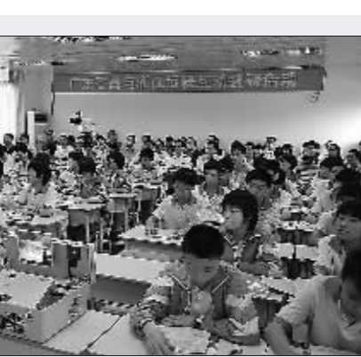
教研经常与外地开展远程互动

与德国 ASG 公益教育集团为姊妹学校,派出教师到德国学习现代职业教育理念技术。众多中小学、幼儿园与港澳学校或教育机构开展教育合作交流。以中小学教师为主体的星海合唱团经常到国外交流演出,并主办了星海国际合唱节。通过对外交流和合作活动,让区内师生不但增长了知识,拓宽了视野,更重要的是感悟、学习到了先进的教育理念,进一步提高了教师教育的前瞻性,深化了现代教育观念,提升了教育的品位,积极的对外交流,有效地发挥了影响力和辐射力,有力地促进了教育国际化、现代化,更提升了番禺教育的整体形象,也使番禺教育逐渐迈向国际化行列。 从1980年起始到2010年,番禺对于教育现代化的梦想一步步坚定地走向现实,推进教育现代化取得显著的成效,呈现出“高位均衡”、“机会公平”、“质量优化”、“手段先进”四大鲜明的特点。 其中“高位均衡”主要体现在学前教育整体水平提升、义务教育城乡一体化发展、高中阶段教育优质协调发展方面。“机会公平”主要体现在该区坚持教育的公益性和普惠性,把促进教育公平作为一项基本的教育政策抓好落实,让番禺的每一个孩子都享受到优质教育。具体包括特殊教育形成品牌、扶贫助学体系完善、外来人员子女教育问题有效解决。“质量优化”即教育质量保持优化态势。以高考为例,2010年高考重点批次上线755人,本科上线4026人,每万人上线率分别为77.37%、78.72%,均创历史新高。仲元中学、番禺中学、象贤中学连续多年获广州市高中毕业班工作综合评分一等奖,其中仲元中学2007年、2008年和2010年3次获一等奖第一名。广州市教育局在该区召开广州市高中新课程实验暨2007年普通高考总结表彰现场会,区教育局及仲元中学在会上获邀介绍做法和经验,获得市同行的赞誉。“手段先进”体现在通过信息化和教育科研两大手段,推进教育改革创新。该区信息化建设投入大、配置高、应用广、成效好的特点。教育科研和教育综合改革得到提速成就显著:过去的5年间,该区获批各级各类教育科学规划立项课题455项,其中教育部课题5项,省级