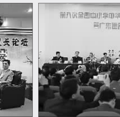
“岭南校园文化与学校品牌建设”校长论坛

改革初期,番禺教育基础相对薄弱、规模较小,学校布局不合理,城乡教育差距较大,发展不均衡,严重滞后于社会经济的发展。