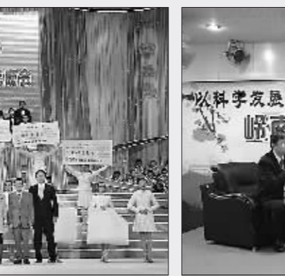
“岭南校园文化与学校品牌建设”校长论坛

改革初期,番禺教育基础相对薄弱、规模较小,学校布局不合理,城乡教育差距较大,发展不均衡,严重滞后于社会经济的发展。