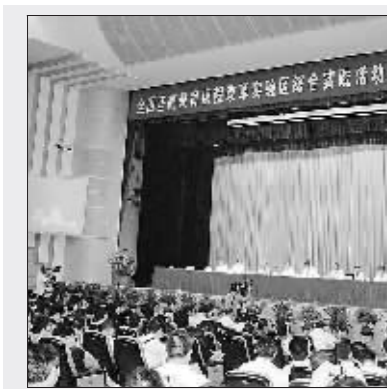
合实践课程第八期研讨会

番禺推进教育现代化走过哪些阶段,有哪些喜人的成就和特色呢?在创建“广东省推进教育现代化先进区”即将迎来省的领导评估之际,笔者近日深入番禺,为您一一剖析。