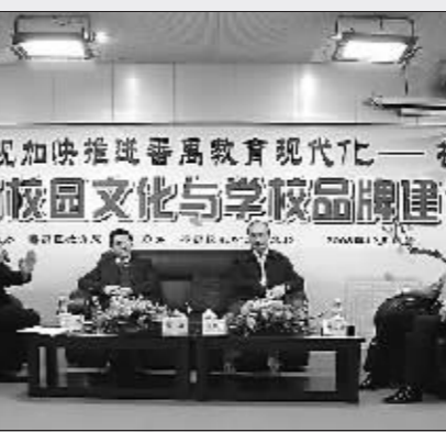
“岭南校园文化与学校品牌建设”校长论坛