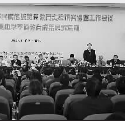
“岭南校园文化与学校品牌建设”校长论坛

创建广东省教育强区工作方案》,努力实施中小学布局调整工程、教育强镇及等级学校创建工程、教育信息化建设工程、校长和教师队伍优化工程、科研兴教工程等“五大工程”。2002年6月,沙湾镇成为广州地区第一个广东省教育强镇;005年12月,番禺区成为广州市第一个设有行政镇村的广东省教育强区,其后10个镇全部成为省教育强镇的目标,实现了由从农村教育向城市教育的华丽转身。