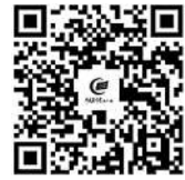
扫二维码 看新专业视频介绍

今年,有24种新专业被正式纳入本科专业目录,并同步列入相关高校的本科招生计划。这些新专业究竟“新”在何处,将如何培养国家战略人才和区域发展急需紧缺人才,就业前景如何?对于考生来说,既要有勇气做“第一个吃螃蟹的人”,也要将这份勇气建立在充分了解的基础上。本期,高教周刊特邀对其中19种新专业最了解也最有发言权的师长,为考生答疑解惑。