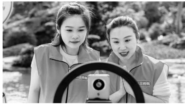
重青院“红岩网姐”直播志愿服务团在太寺垭森林公园开展重庆农特产品直播活动