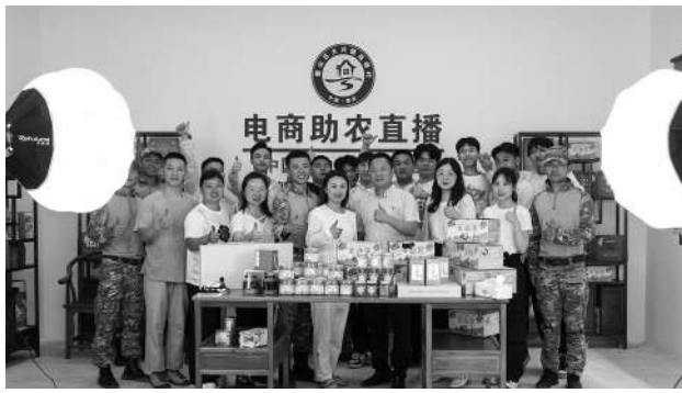
跨境电商专业群师生与退役军人主播在璧山区大兴镇高桥村开展电商助农直播活动

结合“校政企行”多方资源，实施电子商务专业社会扩招计划，开发专门的乡村振兴人才培养课程，为扩招班学生提供学历提升机会，培养一批扎根乡村的专业技术技能人才。在班级组建模式上，采用退伍军人、留守青年、返乡创业青年联合组班的形式，充分利用彼此优势，实现个人资源错位、互补，实现共同致富及共同创业。