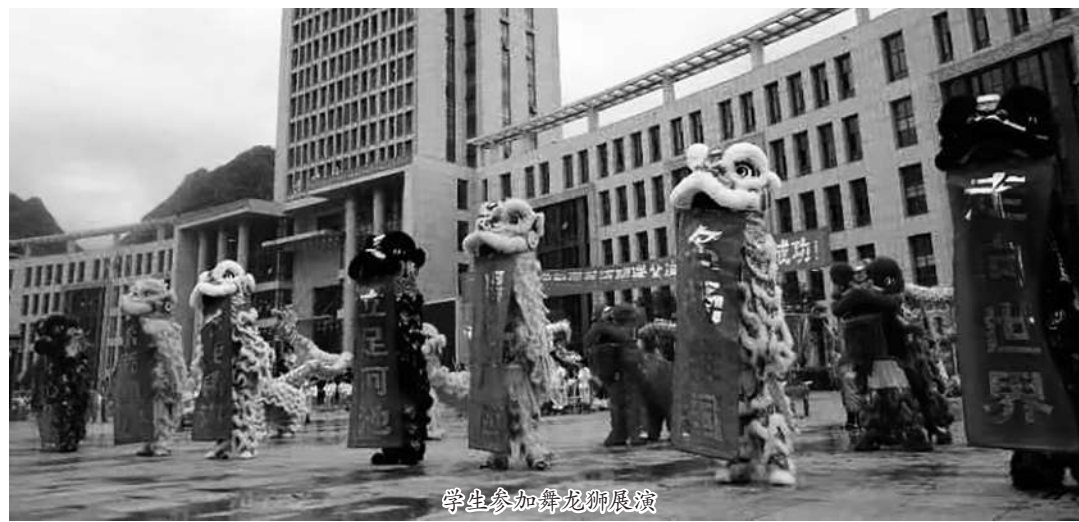
学生参加舞龙展演

态度决定成败，格局决定结局。为了把铸牢中华民族共同体意识的精神落到实处、取得实效，两校党委主动担当，认真谋划。一是纳入学校党委工作计划和人才培养计划。二是由学校党政主要领导任组长的领导小组负责传承民族文化、铸牢中华民族共同体意识工作。三是建立工作保障体系。2008年，河池市职教中心学校筹措100万元，作为项目启动资金。近年来，广西现代职业技术学院投入经费1000万元，构建了“六有”（有组织、有领导、有目标、有措施、有落实、有成效）工作保障体系。四是融入课堂教学。通过开展传承中华优秀传统文化、全面铸牢中华民族共同体意识教育融入日常教学中，引导学生自觉树立维护民族团结进步的意识。五是构建传承活动体系。通过“三月三”等民族文化展演活动，构建传承活动工作体系，营