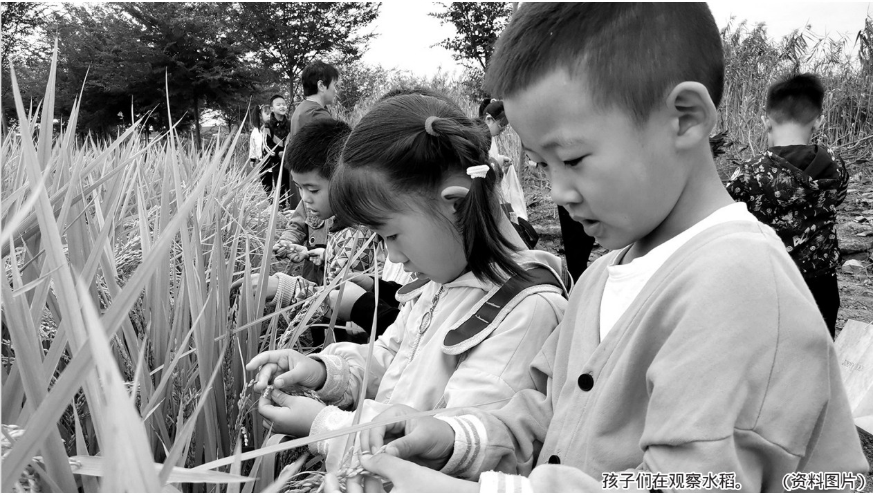
孩子们在观察水稻。(资料图片)

编者按 近年来,随着人口出生率的下降和城镇化进程的加快,许多幼儿园,尤其是农村幼儿园出现了生源短缺的情况,园所规模迅速缩小。但规模缩小不等于质量降低,一些小微幼儿园抓住机会,进行改革,提升质量,比如调整教学组织形式、深入开展师幼互动等,从而诞生了一批小而美、小而优的幼儿园。今起,学前周刊将陆续推出小微幼儿园如何提质的案例,以期对更多幼儿园有所启发。