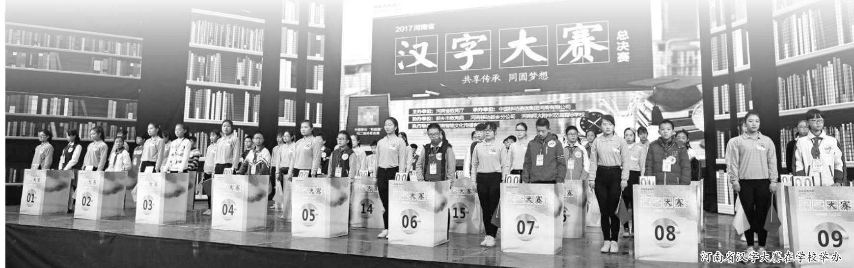
河南省汉字大赛在学校举办