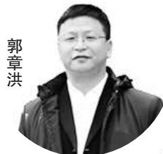
融媒体教育局长访谈

非学科培训机构等社会力量入校服务,形成家校社共同参与的大型课后服务“超市”,调度全县名师、校外专家、行业翘楚成为“超市服务员”,供各所学校开展课后服务工作时挑选。