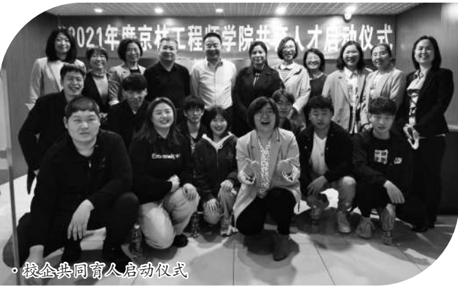
校企协同育人启动仪式