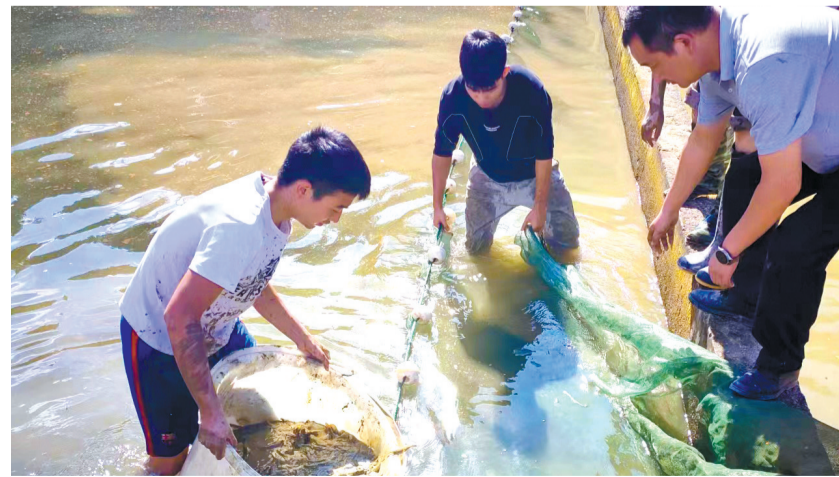
上海海洋大学研究生团队在科技小院开展工作。

把课堂搬到田间地头，希望学生既能学习理论知识，又能培养解决实际问题的本领。作为科技小院的