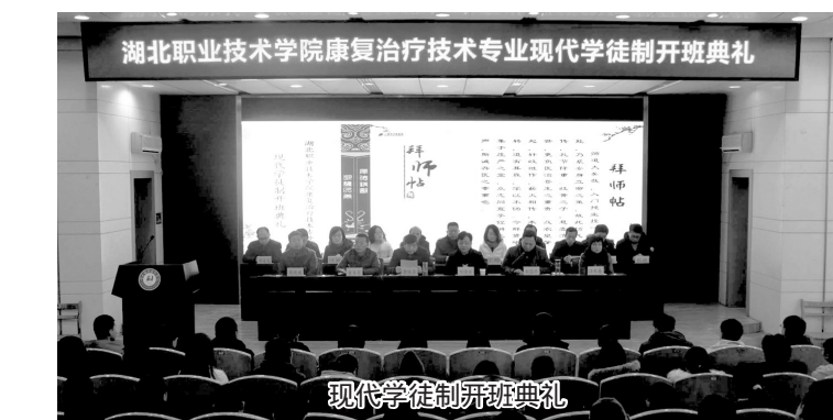
现代学徒制开班典礼

联动开展教学管理,校内实践与校外实践全盘掌控,有效避免了学校医院教学的脱节,可实时监测学生学习情况,反馈学生学习成果,掌握教学进度。同时也极大方便了学生的移动学习,学生随时可在手机上查看学习任务、浏览教学课件及视频、完成布置作业、进行阶段考核。