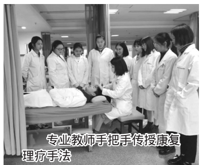
专业教师手把手传授康复治疗手法

(四) 建设一平台、一中心、三医院产教融合实训基地。一平台指职教云平台,一中心指学校康复实训中心,三医院是指参与医教协同、联合育人的孝感市中心医院、孝感市第一人民医院、孝感市中医医院。基础实践环节由专业教师带领在康复实训中心完成,临床实践环节由医院师傅带领在医院康复科完成。借助信息技术,校院双导师团队利用职教云平台,