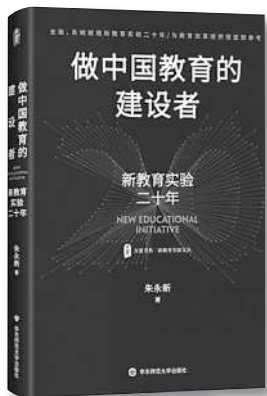
《做中国教育的建设者》——新教育实验二十年著 朱永新著 华东师范大学出版社·大夏书系

形成“过一种幸福完整的教育生活”这一新教育实验的核心使命。这一使命旨在追求“完整的人格、完整的生命、完整的育人体系、完整的教育质量”。“一群又一群长大的孩子，从他们身上能清晰地看到：政治是有理想的，财富是有汗水的，科学是有人性的，享乐是有道德的。”朱永新教授对“新孩子”的描述，正是当下中国教育“立德树人”目标的形象诠释。