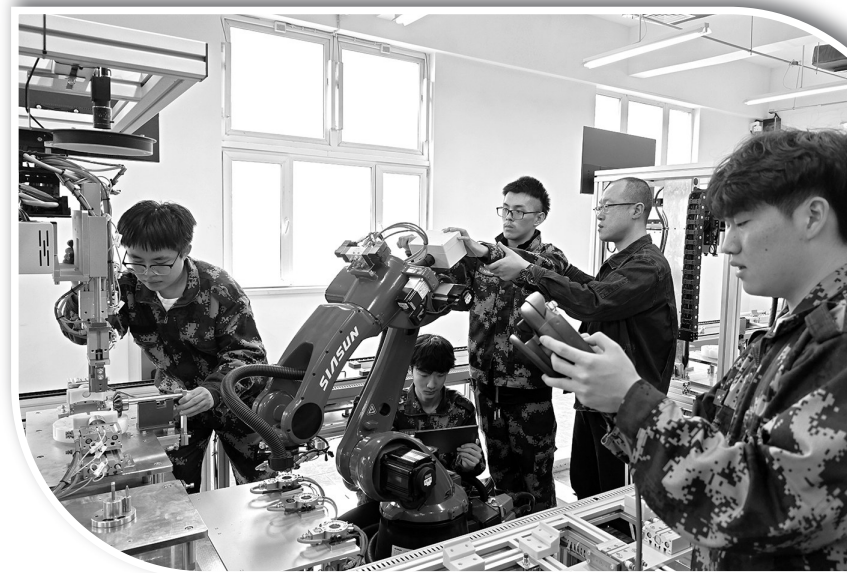
▲中德园产业学院物联网应用技术专业师生在开展工业级汽车产业链产品自动化生产线调试现场教学。

为培养技术技能型人才,对接区域产业用人需求,辽宁轨道交通职业学院与沈阳东洋异型管有限公司共建混合所有制装备制造产业学院,与中德(沈阳)高端装备制造产业园共建中德园产业学院,与沈阳远大智能工业集团股份有限公司共建电梯产业学院。