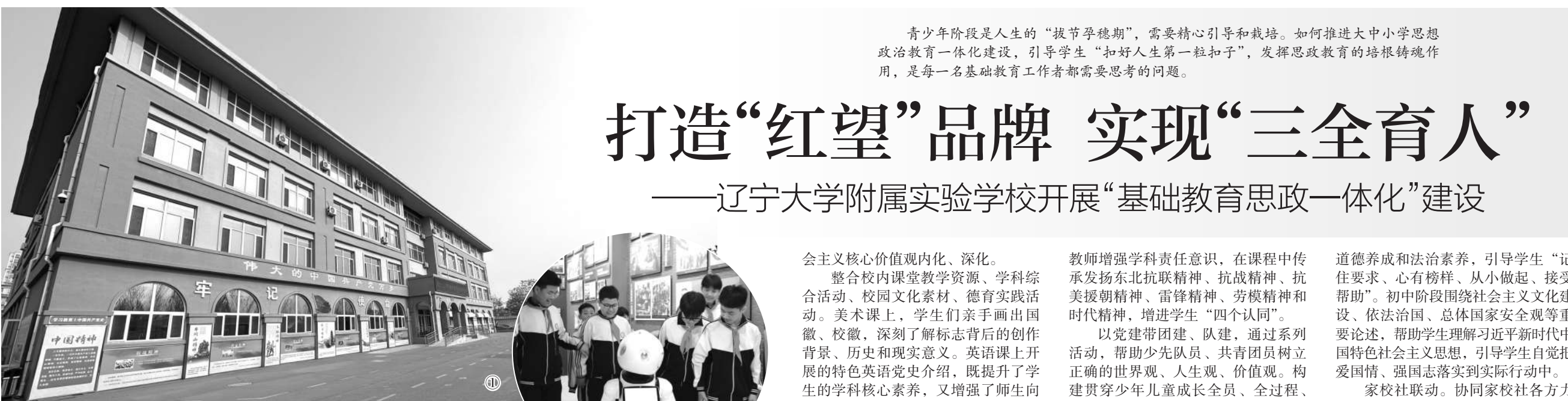
青少年阶段是人生的“拔节孕穗期”，需要精心引导和栽培。如何推进大中小学思想政治教育一体化建设，引导学生“扣好人生第一粒扣子”，发挥思政教育的培根铸魂作用，是每一名基础教育工作者都需要思考的问题。