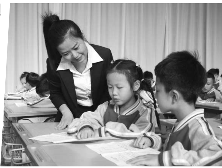
“学为中心”的课堂教学