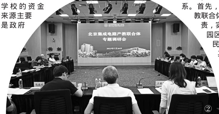
北京集成电路产教联合体专题研讨会

其次,需要建立健全的决策机构和程序,通过设立董事会和理事会等机构,确保各方利益得到充分