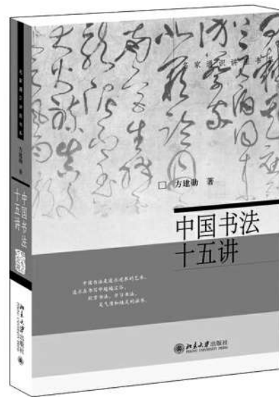
《中国书法十五讲》 方建勋 著 北京大学出版社

有个学生在课程结束时，写下这么一段笔记：“在忙碌的期末季，在被各种作业和论文的截止日期追赶时，我突然发觉，书法的课后练习并不是一项让我感到焦虑的作