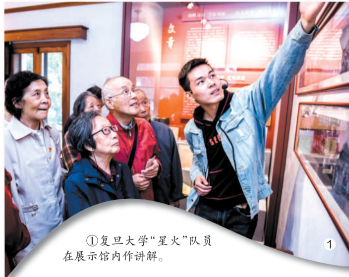
①复旦大学“星火”队员在展示馆内作讲解。