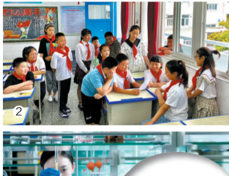
②江苏省淮安市新安小学少先队员阅读习近平总书记的回信。