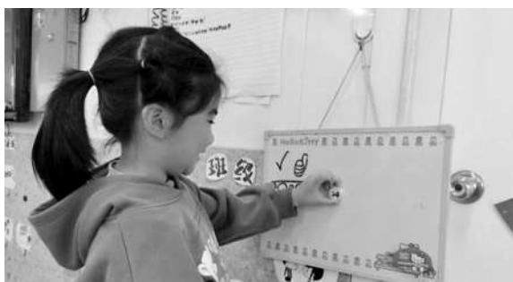
▶幼儿用餐“光盘”后,将个性磁铁吸在“夸夸板”上。(资料图片)

智慧缘起: 劳动教育是教育的重要一环,幼儿期是习惯养成的关键阶段。为了让幼儿爱上劳动,掌握劳动技能,我们开展了“今天我值日”活动。对于值日生的工作内容,幼儿展开讨论,在方案辩论、投票筛选后决定创设一面“值日墙”。当时,班级正在开展“磁铁的秘密”主题活动,幼儿联系经验,提出可以用磁铁布置墙面。于是,我们充分利用班级材料,如磁铁、回形针等,关于“值日墙”的故事就这样开始了。