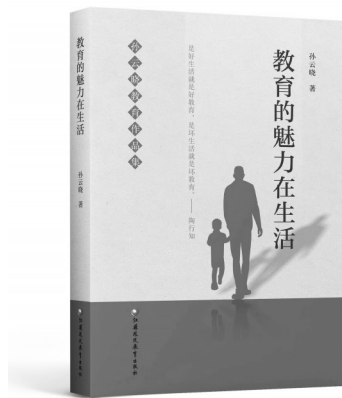
《教育的魅力在生活》 孙云晓 著 江苏凤凰教育出版社

原则。一个中心是指以儿童生命成长为中心，两个原则是坚持有意思与有意义相统一的原则。一方面，家庭生活教育中的生活是儿童的生活，不是成人的生活，不能用成人的生活或者成人自认为正确的生活简单代替或等同于儿童的生活。这正如陶行知所说的，要是儿童的生活才是儿童的教育，要是成人的残酷里把儿童解放出来。以儿童生命成长为中心的儿童生活应满足儿童需要，符合儿童认知与情感并随着儿童发展的不同阶段而有所变化。儿童早期阶段的生活主要是在父母养育下的体验行为之中，3岁以后主要体现在父母陪伴下的各种游戏和探索行为之中，6岁以后主要体现在父母和老师引导下的学习、实践和交往活动之中，12岁以后主要体现在成人参与下的各种主体性活动之中。另一方面，儿童生活设计要符合有意思和有意义相统一的原则，也就是说儿童的生活既要让孩子喜欢又要保障符合教育目标。要做到这些，首先就要注重生活的多样性。生命的样态决定生活的样态，生命是多姿多彩的，生活也应该是多姿多彩的，单调枯燥的生活是教育的大敌。其次要处理好他主与自主的关系。要坚持先他主再自主，他主是尊重儿童真实意愿，自主时家长要起到参谋和把关作用。最后要处理好学与玩的关系。一般来说，学龄前的儿童玩就是学，学在玩中；到了小学低年级，学与玩要并重；到了小学高年级以后，应该以学为主，学要学会玩。