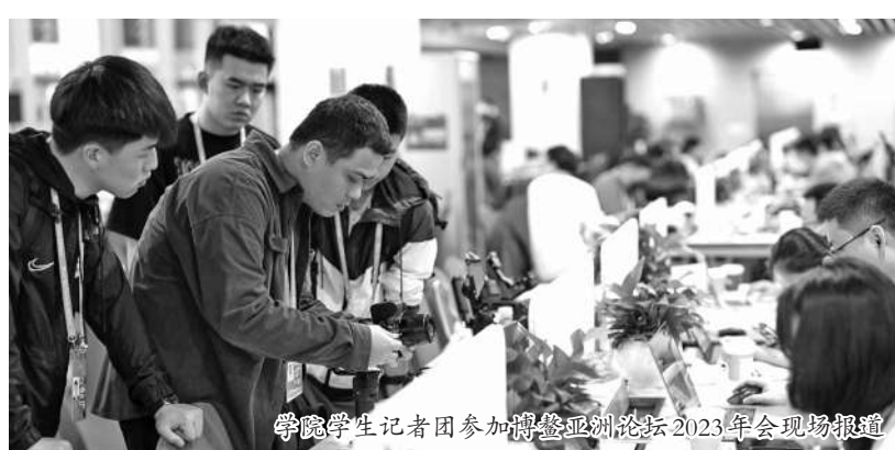
学院学生记者团参加博鳌亚洲论坛2023年会现场报道

近年来，海口经济学院中广天择传媒学院一直坚持产教融合发展，深化校企合作，服务地方社会经济发展。今年4月，学院成功入选“海南省首批现代产业学院立项建设名单”，这所实践型传媒院校用创新理念和不懈努力，探索出了一条产教融合、实践育人的道路。