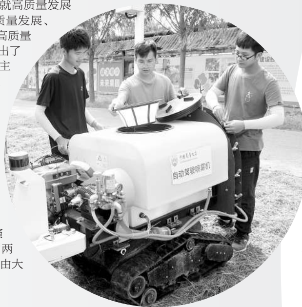
上图为北京市平谷区峪口镇西营村“未来果园”,中国农业大学研究生正调试自动驾驶喷雾机。