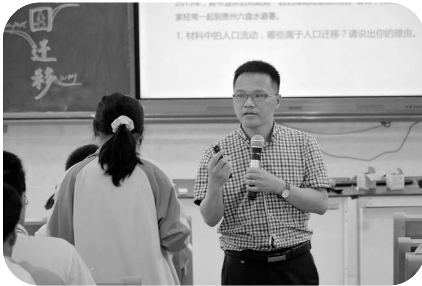
海南中学教师在上思维导学示范课。