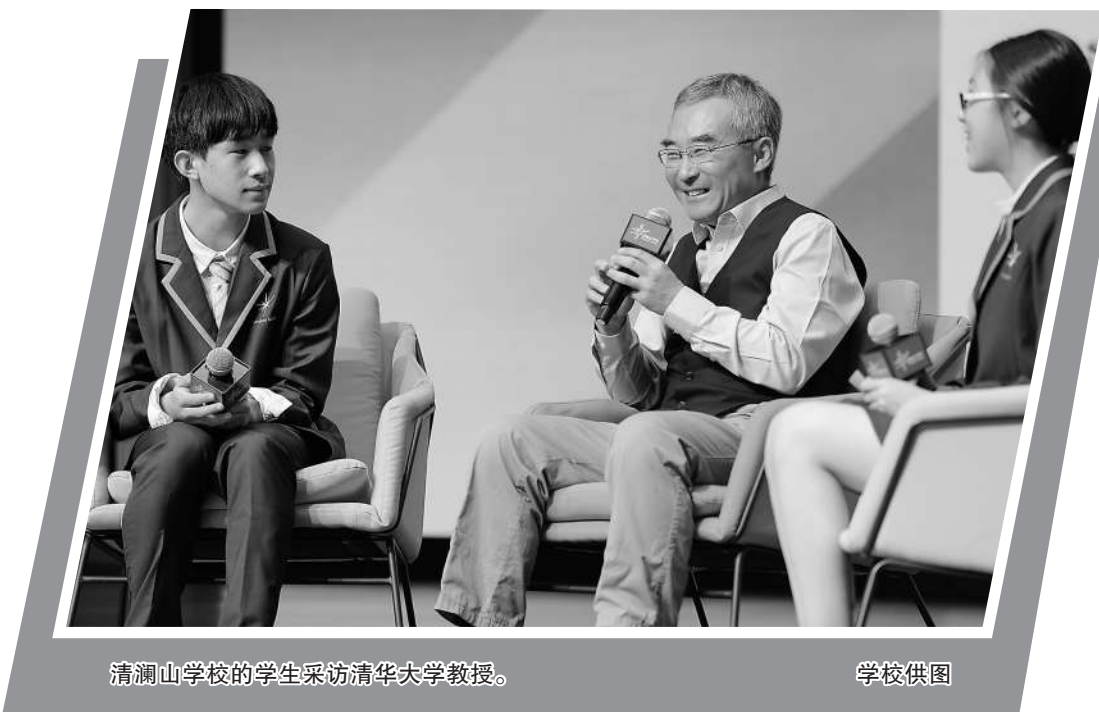
清澜山学校的学生采访清华大学教授。

什么样的基础教育才能更有利于拔尖创新人才的培养?结合“清翔计划”,笔者认为应该具备如下5个要素。