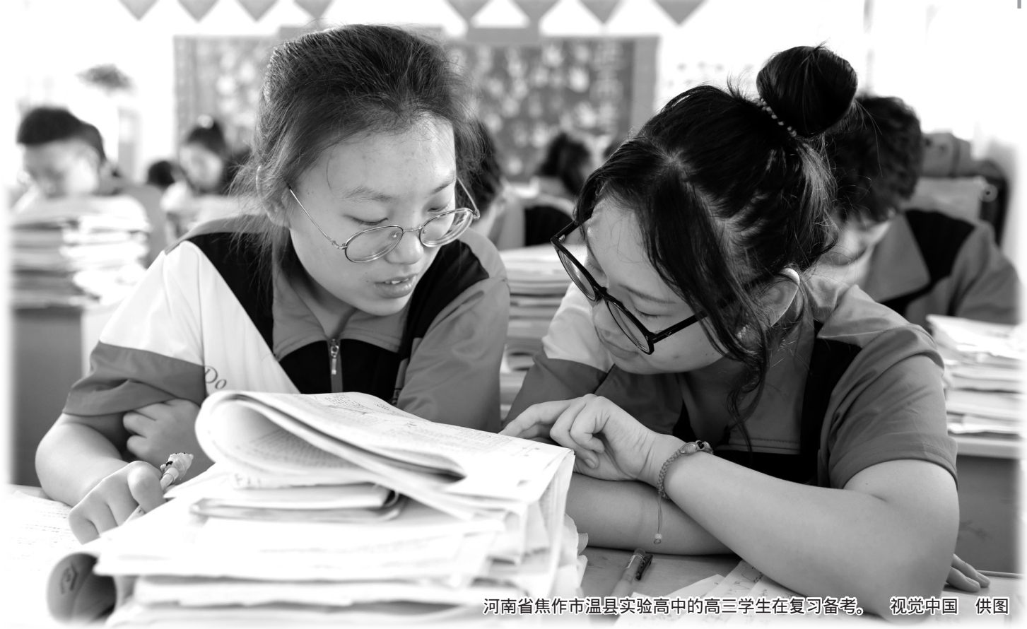
河南省焦作市温县实验高中的高三学生在复习备考。