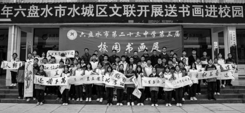
年六盘水市水城区文联开展送书画进校园