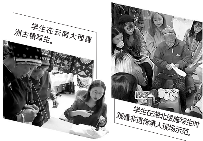
学生在云南大理喜洲古镇写生。