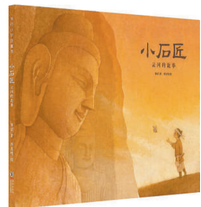
《小石匠：云冈的故事》 郑岩 著 李小明 绘 海豚出版社

郑岩以云冈的诞生、流变为主线，通过塑造和小读者年龄相仿的主角小石匠，拉近了孩子们与这座石窟的距离。在艺术品的感染下，在对位的代入感中，当小读者回忆起那些高大肃穆的佛像时，他们便不再属于遥远陌生的历史，而是小石匠曾经来过的地方，是小石匠曾经打过的铁。可以说，孩子们见证了具象化的小石匠们去制造辉煌的过程。如此，他们真实地感受到了“文明”“文化”等抽象概念背后非常具体的一个人，理解了“制造中国”中突出的人的努力奋斗、人发挥的作用。