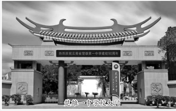
楚雄一中学校大门

作为一所办学历史悠久的名校，作为楚雄州高中教育的优秀代表，云南省楚雄第一中学（以下简称“楚雄一中”）审视新境遇、新使命和新任务，聚力“三优+特色”（教育优质、校风优良、环境优美，体育和艺术特色），努力把楚雄一中打造成“一流环境、一流教师、一流品质”的“云南一流名中”“中国特色名校”而努力奋斗！