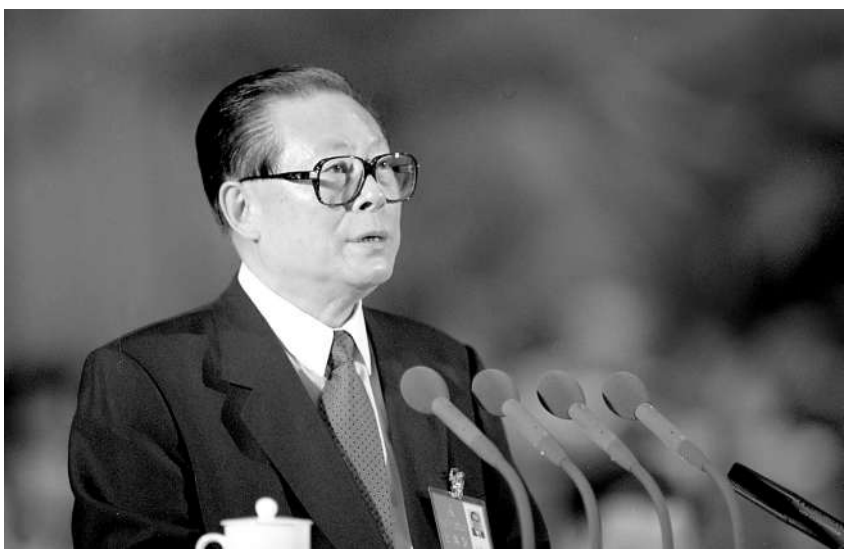
上图:1997年9月12日,中国共产党第十五次全国代表大会在北京人民大会堂开幕。这是江泽民同志代表第十四届中央委员会作报告。