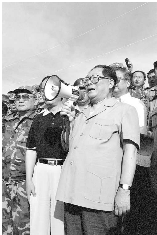
左图:1998年8月13日至14日,江泽民同志亲赴湖北长江抗洪抢险第一线,看望、慰问、鼓励奋战在抗洪抢险第一线的广大军民,指导抗洪抢险斗争。这是8月13日江泽民同志在洪湖市乌林镇中沙角险段大堤上,向正在抗洪抢险的军民发表讲话。