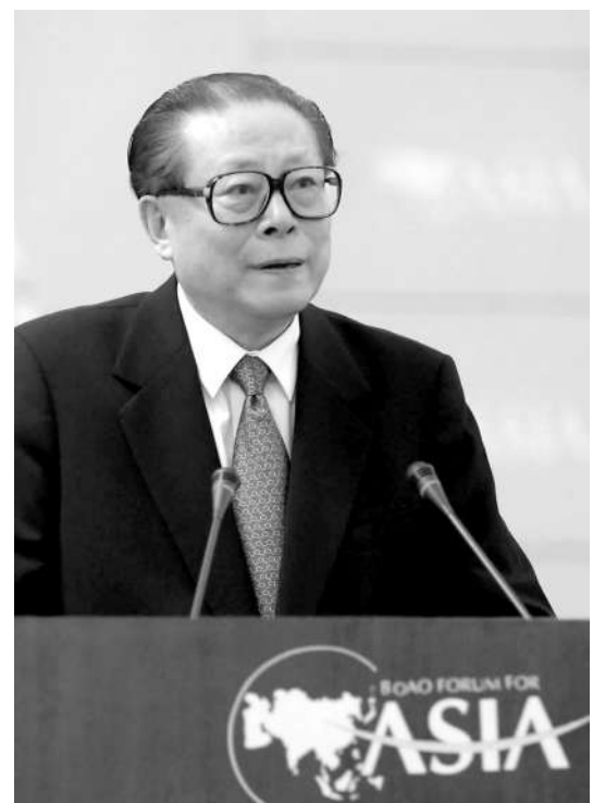
上图:2001年2月27日,博鳌亚洲论坛成立大会在海南举行。江泽民同志出席成立大会并致辞。