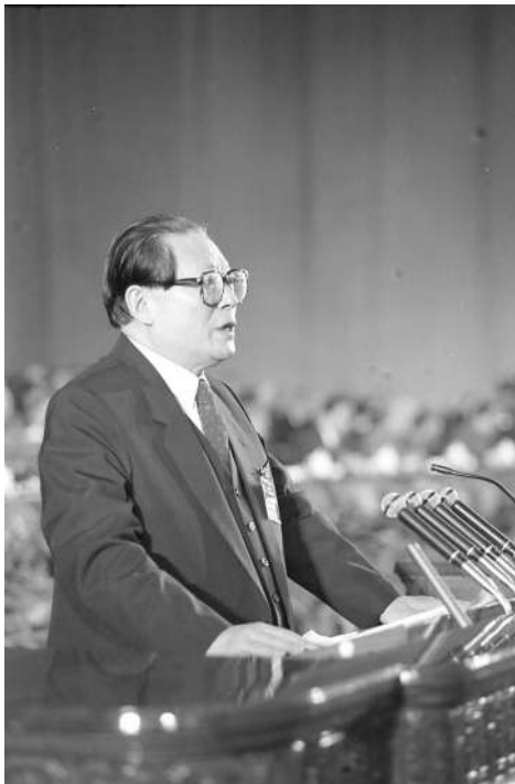
左图:1992年10月12日,中国共产党第十四次全国代表大会在北京人民大会堂开幕。这是江泽民同志代表第十三届中央委员会作报告。