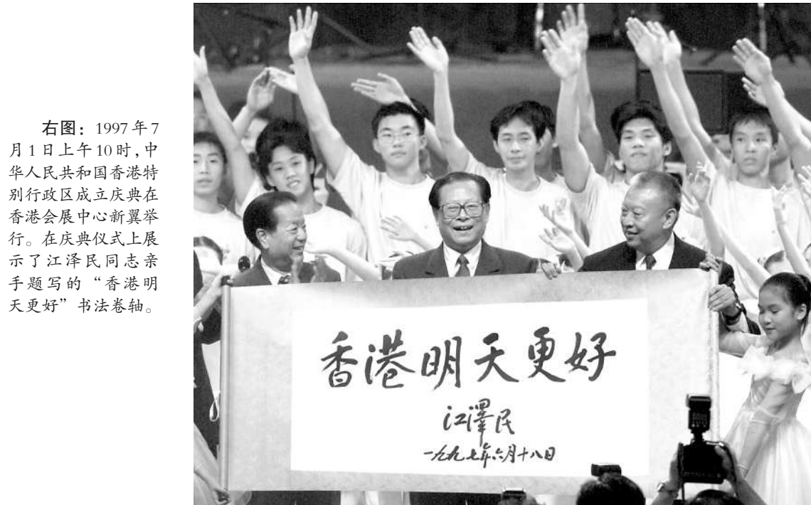
右图:1997年7月1日上午10时,中华人民共和国香港特别行政区成立庆典在香港会展中心新翼举行。在庆典仪式上展示了江泽民同志亲笔题写的“香港明天更好”书法卷轴。