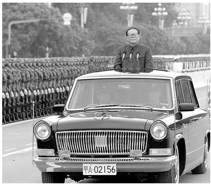
左图:一九九九年十月一日,中华人民共和国成立五十周年盛大庆典在北京天安门广场举行。江泽民同志检阅由人民解放军陆海空三军和人民武装警察部队、民兵预备役部队组成的地面方阵。