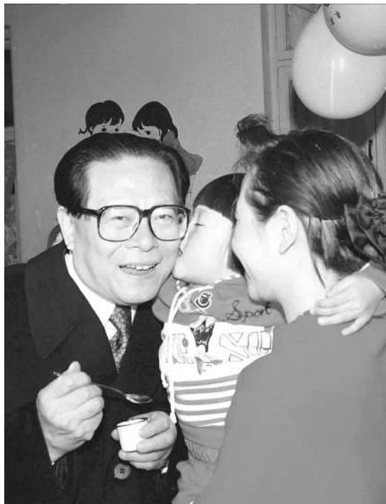
右图:1993年12月5日,江泽民同志在北京为一位幼儿园儿童喂服脊髓灰质炎疫苗后,小朋友亲吻江爷爷。