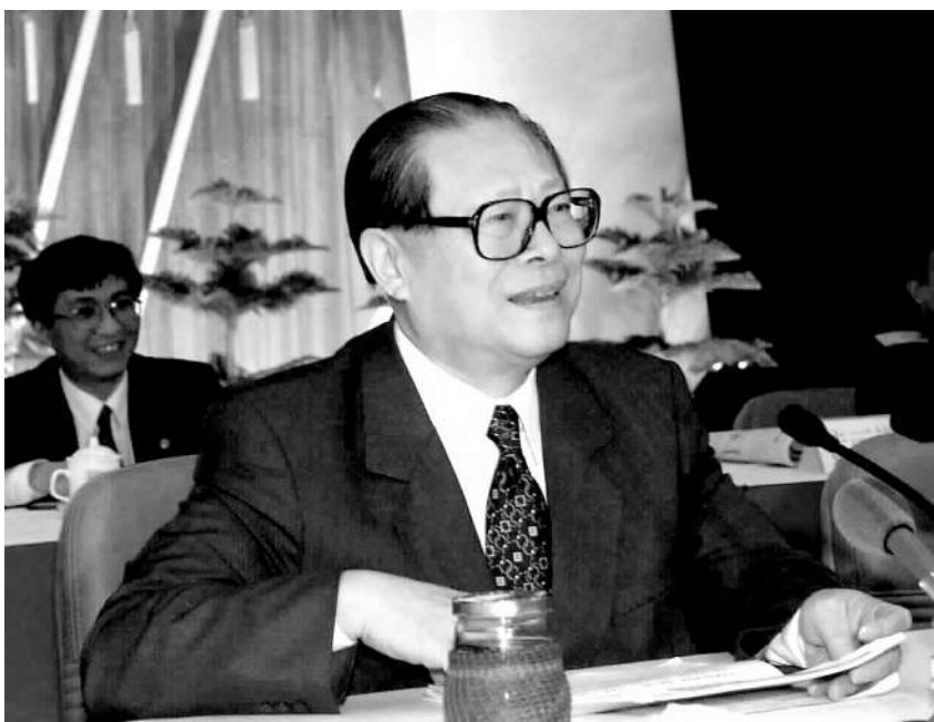
上图:2000年2月20日,江泽民同志在广东省高州市领导干部“三讲”教育会议上发表重要讲话。在这次广东考察中,江泽民同志提出,我们党总是代表着中国先进生产力的发展要求,代表着中国先进文化的前进方向,代表着中国最广大人民的根本利益。