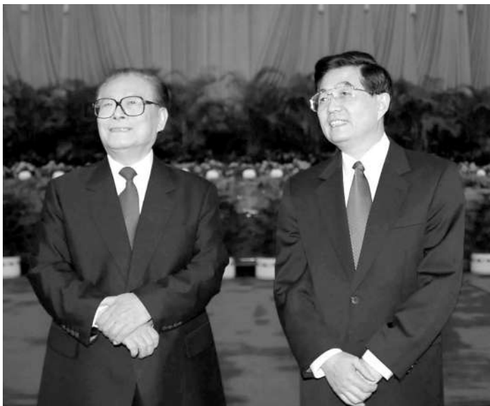
左图:2002年11月15日,江泽民同志、胡锦涛同志在北京人民大会堂亲切会见出席党的十六大代表、特邀代表和列席人员并发表重要讲话。