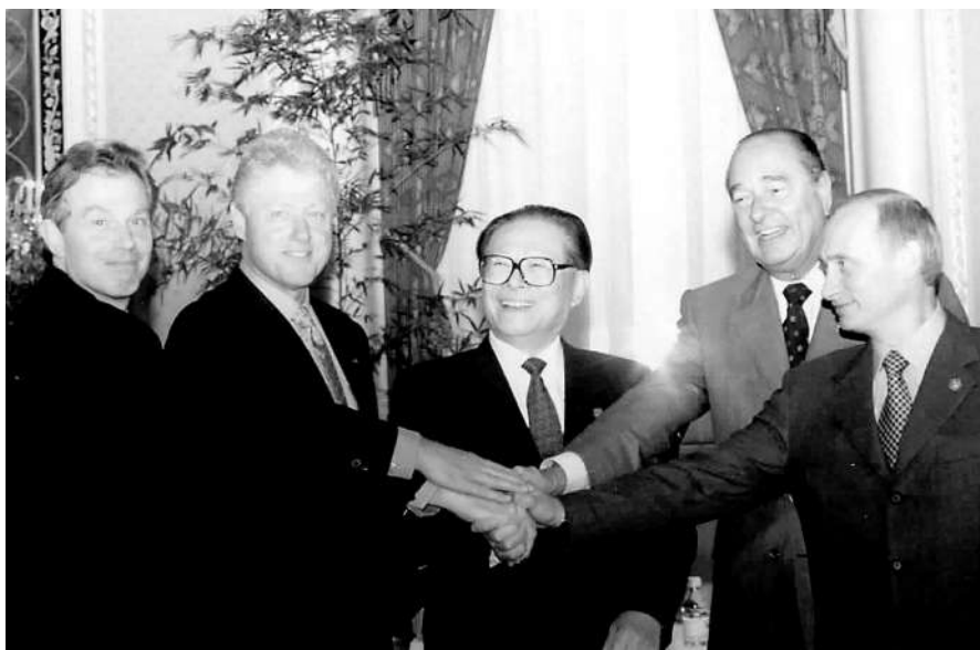
左图:2000年9月7日,由中国倡议的联合国安理会五个常任理事国首脑会议在纽约举行。江泽民同志(中)同法国总统希拉克(右二)、俄罗斯总统普京(右一)、英国首相布莱尔(左一)、美国总统克林顿(左二)握手合影。