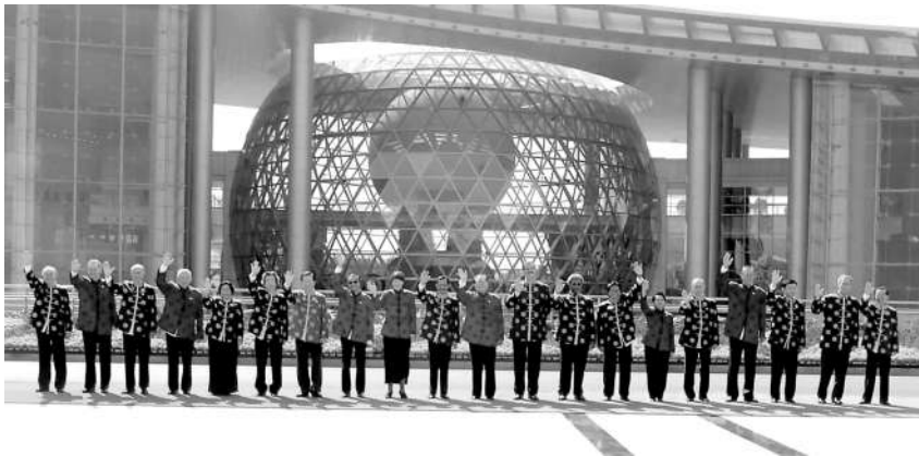
左图:2001年10月21日,亚太经合组织第九次领导人非正式会议在上海举行。这是江泽民同志与参会的经济体领导人合影。