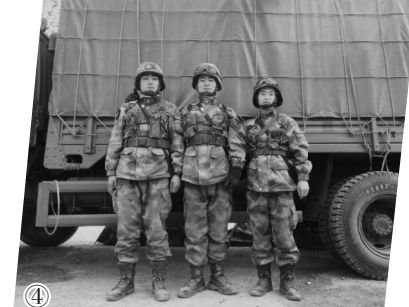
①指导学生第二课堂活动 ②学生第二课堂学习场所 ③课程实践教学师生合影 ④思政育人成效——学生参军