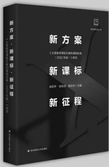
《新方案·新课标·新征程：〈义务教育课程方案和课程标准（2022年版）〉研读》 吴刚平 安桂清 周文叶 主编

如何理解《义务教育课程方案和课程标准（2022年版）》？它有什么特点？会带来什么样的影响？对教育工作者来说，将会面临什么样的挑战？