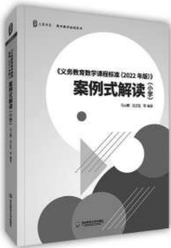
《〈义务教育数学课程标准（2022年版）〉案例式解读（小学）》 马云鹏 吴正宪 等著