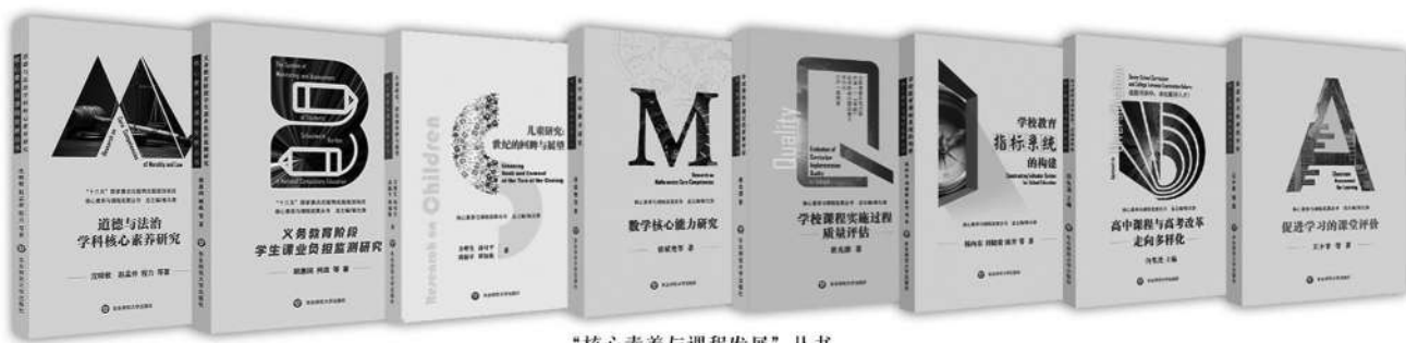
“核心素养与课程发展”丛书 崔允漭 总主编

全书按照义务教育课程新方案新标准的修订思路，结合中小学实际需要，重点阐述了新方案新标准的时代特点和育人价值、“三有”培养目标和核心素养、新方案新课标修订十大问答等共计24章专题内容，从指导思想、修订原则、主要变化和迎接挑战等方面，阐释了新方案新课标的改革特点，并就实施推进所面临的新问题和新的挑战提出了策略建议。