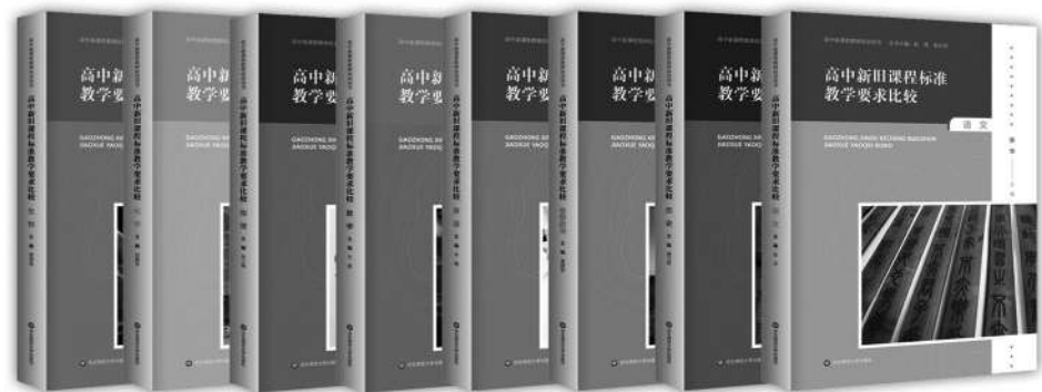
“高中新旧课程标准教学要求比较”丛书（8册） 徐勇 徐山洪 主编