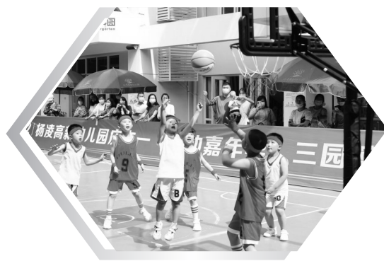
2022年杨凌高新幼儿园的孩子们参加篮球比赛

地、陕西省幼儿园园长研训基地，幼儿园在自我发展提升的基础上，秉承资源共享、优势互补、合作共赢的原则，充分发挥优质幼儿园的辐射带动作用，与杨陵区12所农村幼儿园手牵手、共成长，主动承担起乡村幼儿园教师的培训与指导工作。先后赴凉山、怒江、株洲、柞水等省内外各地的30余所幼儿园进行帮扶支教，促进学前教育均衡发展。2017年起承担办园项目，累计培训学员400余人，覆盖省内多个地市，园培经验在全省进行交流分享。近年来，园所先后接待全国多个省份800余所幼儿园近万人来园交流学习，为学前教育高质量发展贡献了力量。此外，幼儿园倡导舍小家为大家的奉献精神，多年来坚持每年开展大地之爱、母亲水窖捐赠、10元关爱慈善一日捐等活动，连年荣获杨凌示范区慈善公益事业光荣榜。