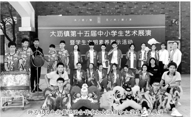
狮艺社团和街舞社团合作参加大沥镇中小学生艺术展演暨学生文明素养展示活动