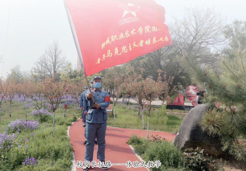
校园长征路——体验式教学

“红色”美育,传递思想政治教育“真善美”。以红色经典音乐贯穿党史学习教育始终,以“行、讲、听、唱”“四位一体”的教育模式,用红色音乐蕴含的红色基因助推党史学习教育“动起来”“实起来”“活起来”“火起来”。开展以党史发展为主题的红歌传唱活动;设计“红歌竞猜”环节的党史知识竞赛;在聊职“校园长征路”搭建“红色课堂”,将《长征组歌》融入“长征步道”的体验式党史教学。开设红色音乐主题党课、团课,用“音乐舞蹈史诗”讲述党史,用听红色音乐、讲党的故事、谈心得体会的形式开设团课,新颖活泼的形式坚定了青年学生永远跟党走的决心。结合英雄人物事迹和爱国志士家书开展浸润式阅读、演讲比赛、诵读比赛等活动,以美的人格、美的形式进行价值