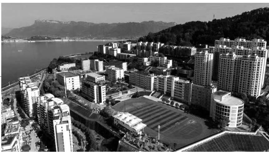
教学诊改 让“三自四联”落实

万里长江波浪奔涌，一路劈开高山深涧。在长江西陵峡畔，有一个美得让长江驻足的地方，它就是爱国诗人屈原的故乡——秭归。