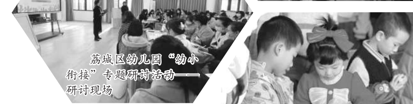
荔城区幼儿园“幼小衔接”专题研讨活动——研讨现场