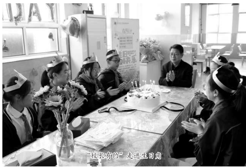
“校长有约”走进生日角

一份小小的德育作业，成为养成责任担当的大天地。学校鼓励学生承担力所能及的家务，做温暖的实践者；带领学生参加“寻访美丽金华”活动，并以视频记录所行所悟，做“足迹”的寻访者；组织学生绘制冬奥精神手抄报，为冬奥健儿加油，做冬奥宣传者；引导学生动手设计节约用水宣传画和“光盘行动”宣传标语，做“节约”的实践者。