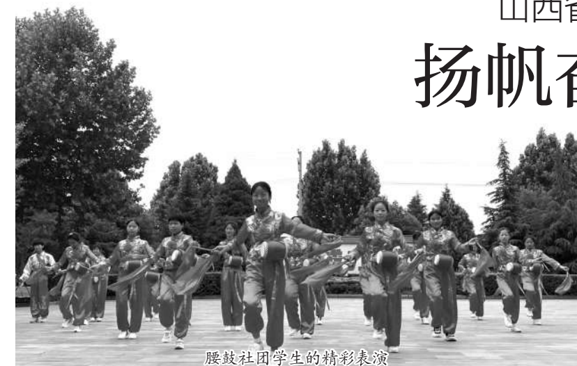
腰鼓社团学生的精彩表演

在“一切为了学生的发展”的新课程改革核心理念指引下，学校迈出了课程改革的第二步——开发课程，