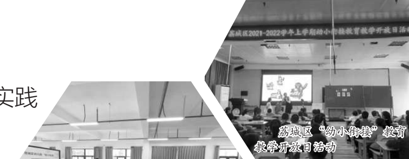
荔城区“幼小衔接”教育 教学开放日活动

家园共育，灵动衔接。家庭是教育的主阵地，做好入学准备离不开家庭的配合。在幼小衔接教研共同体的合力组织下，各幼儿园积极创造条件，让正确的幼小衔接准备在家庭延续。例如，区第二实验幼儿园，开展幼小衔接专题亲子课堂，围绕家长所