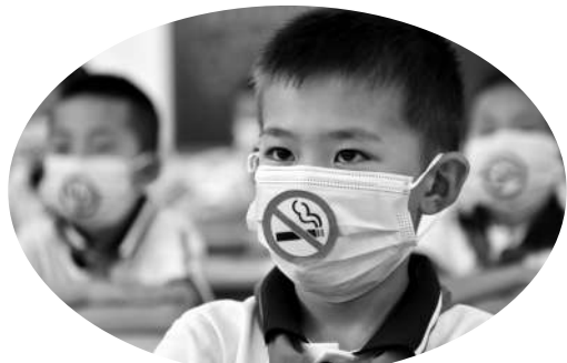
山东省聊城市政法希望小学的学生们戴着贴有禁烟标识的口罩,听老师讲解吸烟的危害。

在5月31日世界无烟日来临之际,各地学校举办相关主题宣传活动,通过宣读倡议书、制作禁烟标识、做吸烟模拟实验等形式,倡导学生争当“禁烟小卫士”。