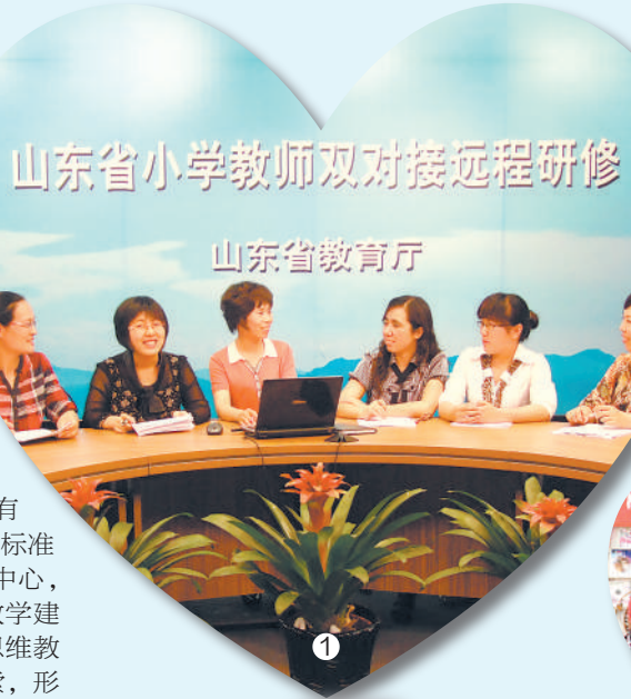
山东省小学教师双对接远程研修

2011年版《义务教育数学课程标准》将“解决问题”改为“问题解决”,提出教学中应注意培养学生的模型思想。由于教师对“模型思想”“数学模型”“数学建模”等概念缺乏清晰而全面的理解和认识,导致教师在教学实践中建模意识淡薄,教学内容脱离生活原型