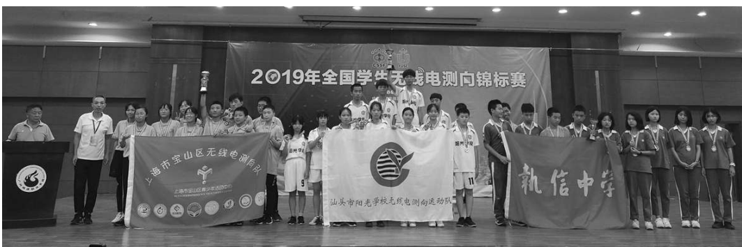
阳光学校2019年参加国家无线电测向比赛获奖