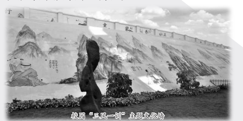
校园“三风一训”主题文化墙

近年来，学校在“以人为本、和谐发展”办学理念的引领下，在“为学生发展奠基、为教师发展铺路、为学校发展改革，均衡发展，全面实施素质教育”办学思想的指导下，凸显“梧桐文化”在学校办学中的引领作用，培养“高贵、优雅、耿直、奉献”的学生，扎实推进素质教育，努力把学校建成“窗口学校，特色学校，品牌学校”。