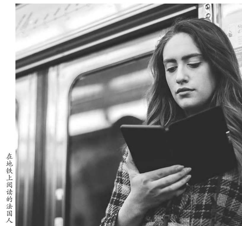
在地铁上阅读的法国人

为更好地迎合互联网一代，法国政府在推广传统阅读的同时，还积极支持有声读物和播客的开发，将其作为让书籍更加大众化的有力举措。例如，法国教育部协同信息媒体联络中心组织开展“学校新闻与媒体周”活动，为学生提供探索媒体多样性的机会。