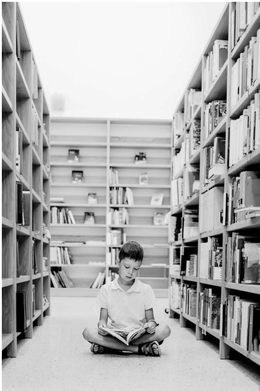
法国要求青少年每天开展阅读活动。