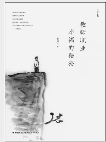
《教师职业幸福的秘密》(增补版) 杨斌 著 福建教育出版社

能否寻找到属于自己的一份职业幸福,是关乎一个人生命质量、生活幸福指数的重要因素,教师的职业幸福也是如此。什么是教师职业的幸福?如何理解和找到这份职业幸福?在杨斌老师的教育随笔《教师职业幸福的秘密》一书中,我有了新的感受。