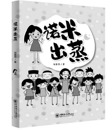
《诺米出蒸》刘家辰 著 中国海洋大学出版社

语文教师就是学生的读书领路人。如今我也成为一名语文教师,经常会把蔡三锁老师教给我的阅读方法,传授给我的学生们。我爱给学生们讲启人心智的故事,爱引导他们去思考其中的道理,我爱让他们去思考优秀作品的构思,爱让他们去汲取好文章中的精华。如今,我的学生们已经在各类报纸上发表40余篇杂文,曾多次获奖,他们对写作的兴致特别高。谢谢我的高三语文老师!把他的薪火传下去,开开,是无比幸福快乐的。(作者系河南省洛阳市宜阳县鹿鹿山镇赵老屯小学教师)