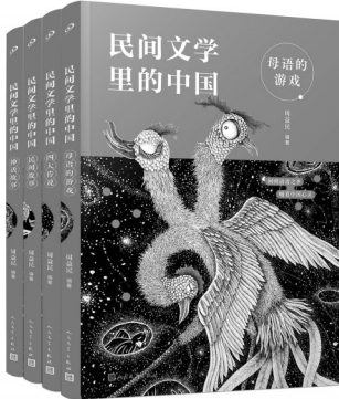
《民间文学里的中国》周益民 编著 人民文学出版社

益民老师是诗化语言的倡导者与实践者,也是一位高水准的音乐迷,他的微信头像以简洁的线条,勾勒出一把大提琴与一位琴师,画面仅黑白两色,秀雅隽永,画如其人。诗性和音乐性也贯穿在了这套他潜心数年的读本中,使之富有鲜明的个人印