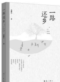
黄耀红 著 漓江出版社

在湖湘文人中，我爱看沈从文先生的脸。有人说：“星斗其文，赤子其人。”沈先生的脸，真是一张干净的脸。