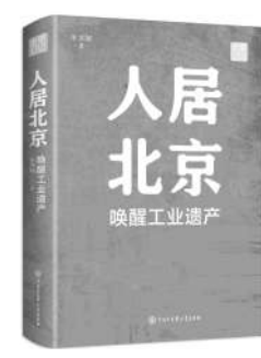
《人居北京：唤醒工业遗产》 中国大百科全书出版社 单霁翔 著

从火花四溢的炼钢厂到北京冬奥组委入驻的首钢园，首钢工业遗产的转型发展奏响了新的“冰与火之歌”。这是一本关于北京城市规划中工业遗产转型发展案例的读本，一场重新认识北京城工业遗产保护再利用的漫游。让人们更深入地感受、热爱北京这座城市。