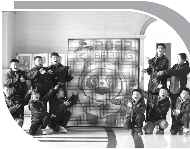
▲2月16日,新学期开学第一天,浙江丽水外国语实验学校的学生用魔方拼出冬奥会吉祥物“冰墩墩”。

在将“软技能”培养纳入学校课程目标时,学校应提供给学生开放式、复杂性的任务,而不是靠死记硬背完成的任务。学校还应引导学生深刻理解与应用核心知识和概念,而不是要求他们记忆割裂、琐碎的知识。学校应教会学生成为自我导航的学习者,而不是仅仅传授事实性知识。