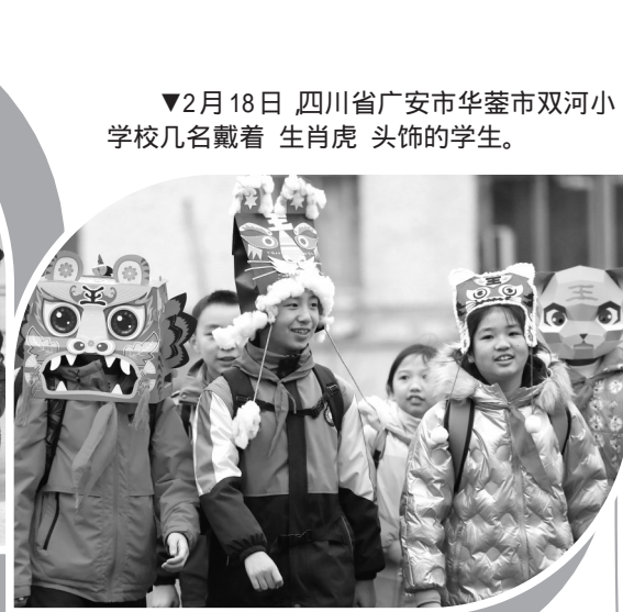
▼2月18日,四川省广安市华蓥市双河小学校几名戴着生肖虎头饰的学生。